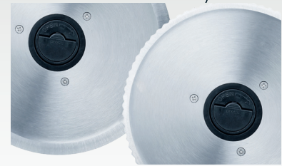
INKLUSIVE 2 MESSER (GLATT UND GEZAHNT)