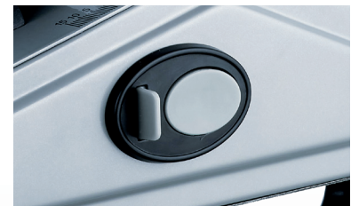
SCHALTER MIT SICHERHEITSVERRIE- GELUNG